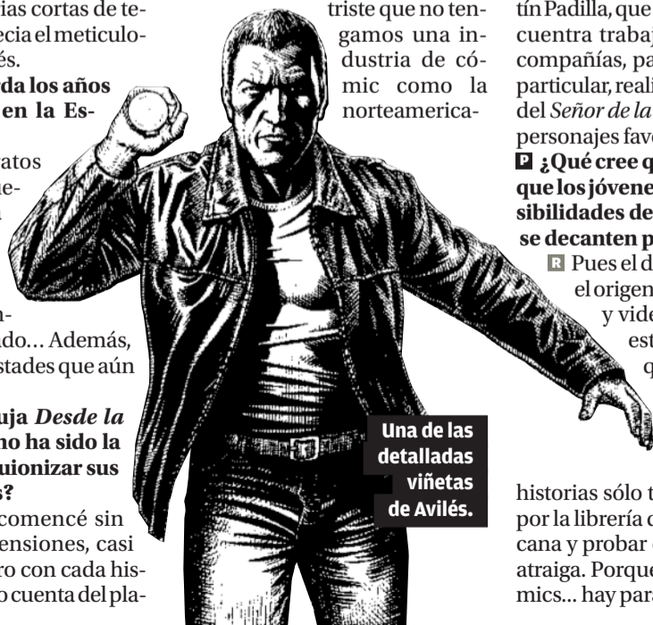
Una de las detalladas viñetas de Avilés.

■ Pues el darse cuenta de que el origen de tantas películas y videojuegos punteros está en los cómics. Y que si quieren saber más de estos personajes tan icónicos y seguir disfrutando de sus historias sólo tienen que pasarse por la librería de cómics más cercana y probar con lo que más les atraiga. Porque en esto de los cómics... hay para todos los gustos.