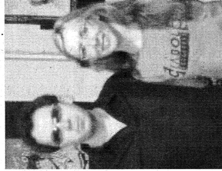
Pascual y Lumbreras. / DA