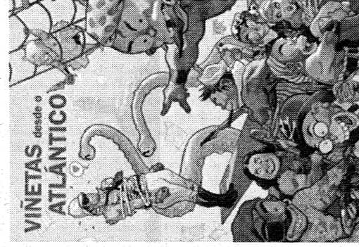
"Viñetas desde el Atlántico". / DA